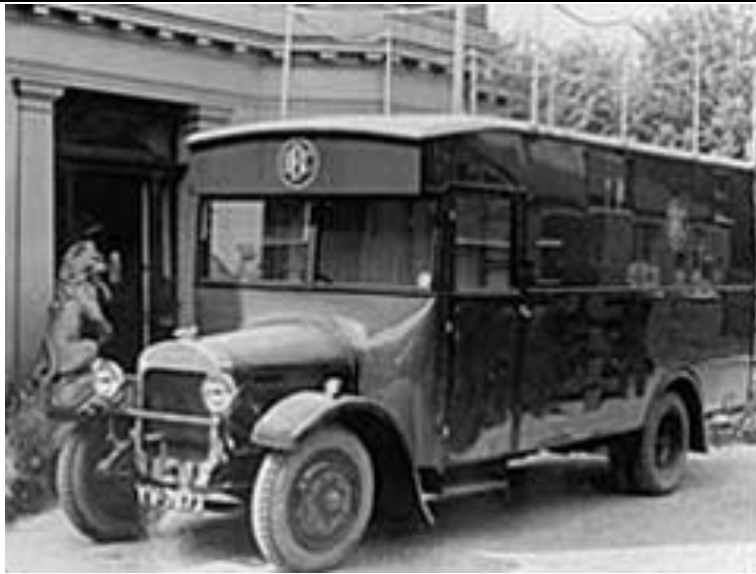
Voiture de reportage (OB, Outside Broadcast, BBC, 1923)

Toutefois, dans une nation où les événements sportifs soulèvent la passion lorsqu'ils opposent des valeurs nationales, telles la compétition annuelle d'aviron, Oxford vs Cambridge, les programmeurs ne sauraient ignorer l'attente impatiente du public que la transmission en direct peut satisfaire.