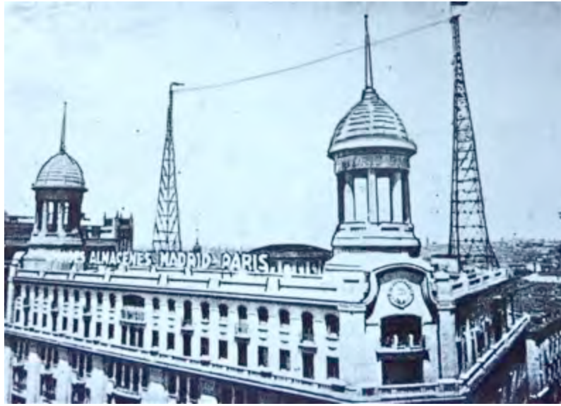
Emetteur d'Unión Radio à Madrid (années 1920)